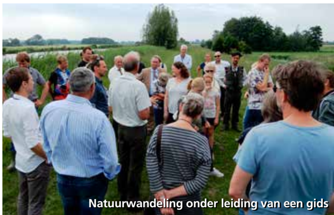
Natuurwandeling onder leiding van een gids