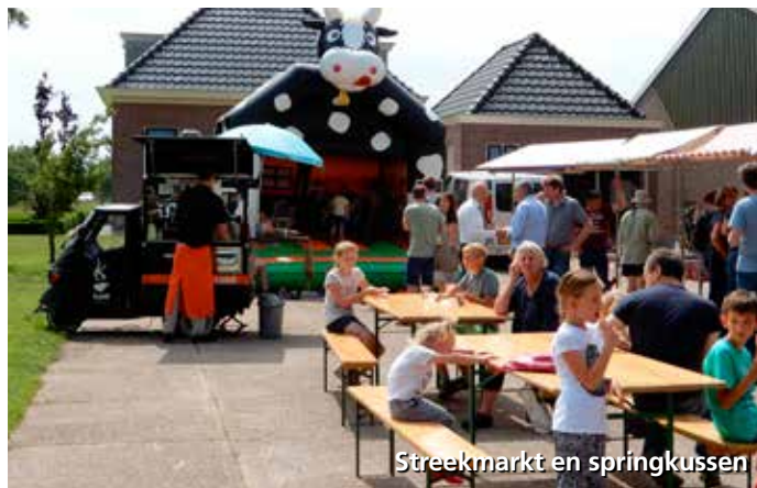
Streekmarkt en springkussen