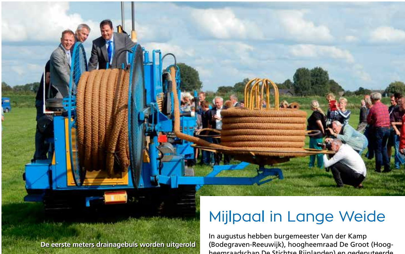
De eerste meters drainagebuīs worden uitgerold