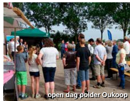
open dag polder Oukoop

De inrichting van Oukoop als natuurgebied is klaar. In juni werd dat gevierd met een open dag op natuurboerderij Hoeve Stein. Ruim honderd bezoekers genoten van gidswandelingen door de natuur, maar ook van de gratis ijsjes, de streekproducten en het springkussen.