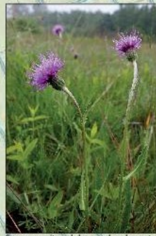
Spaanse ruiters als kenmerkend soort voor de schraalgraslanden